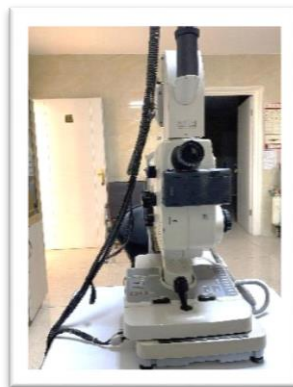
دستگاه فوندوس فتوگرافی

واحد تصویر برداری و آموزش سلامت مرکز آموزشی درمانی چشم نیکوکاری تبریز